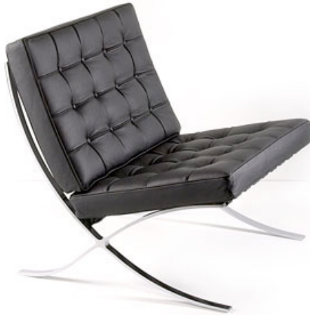
Mies van der Rohe „Barcelona Chair“ 1929

que communique la pièce, à la chevelure, offerte sans défense, de l'homme qui a dû prendre place dans l'un des fauteuils alignés sans soin.