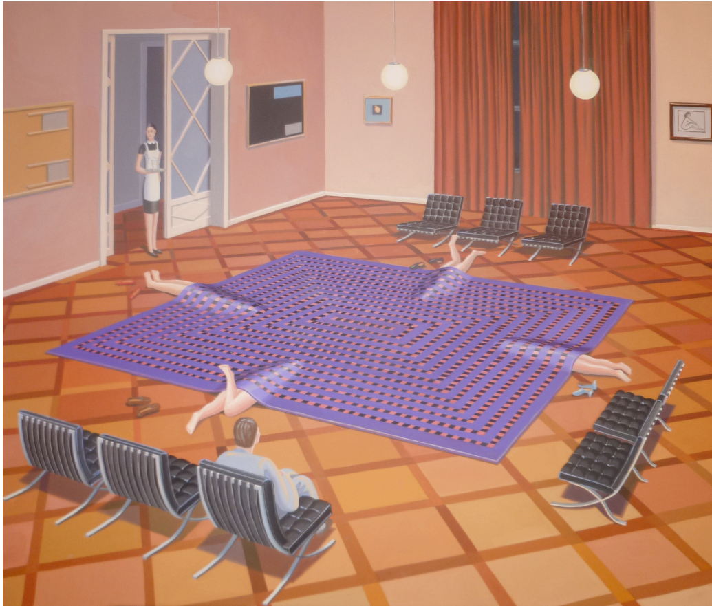
Thomas Huber, Séance , 2009, 120 x 140 cm, huile sur toile

Conférence tenue à l'occasion du vernissage de l'exposition « sauve qui peut », Galerie Skopia, Genève, le 18 mars 2010.